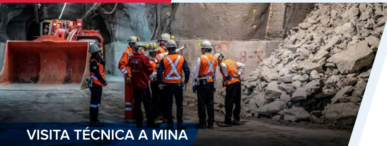
VISITA TÉCNICA A MINA