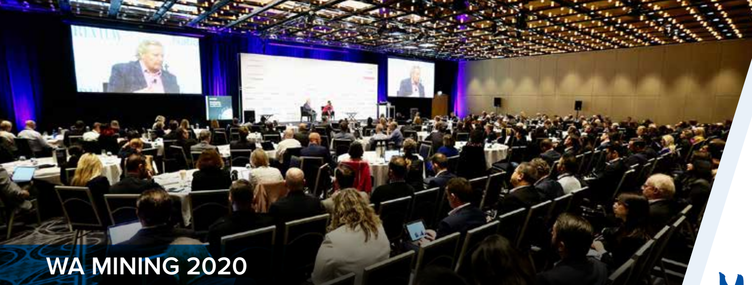
WA MINING 2020