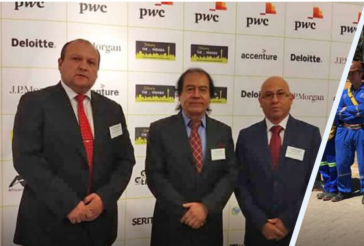
ASISTENCIA A CONGRESO MUNDIAL THE JOBURG INDABA: OCTUBRE 2019