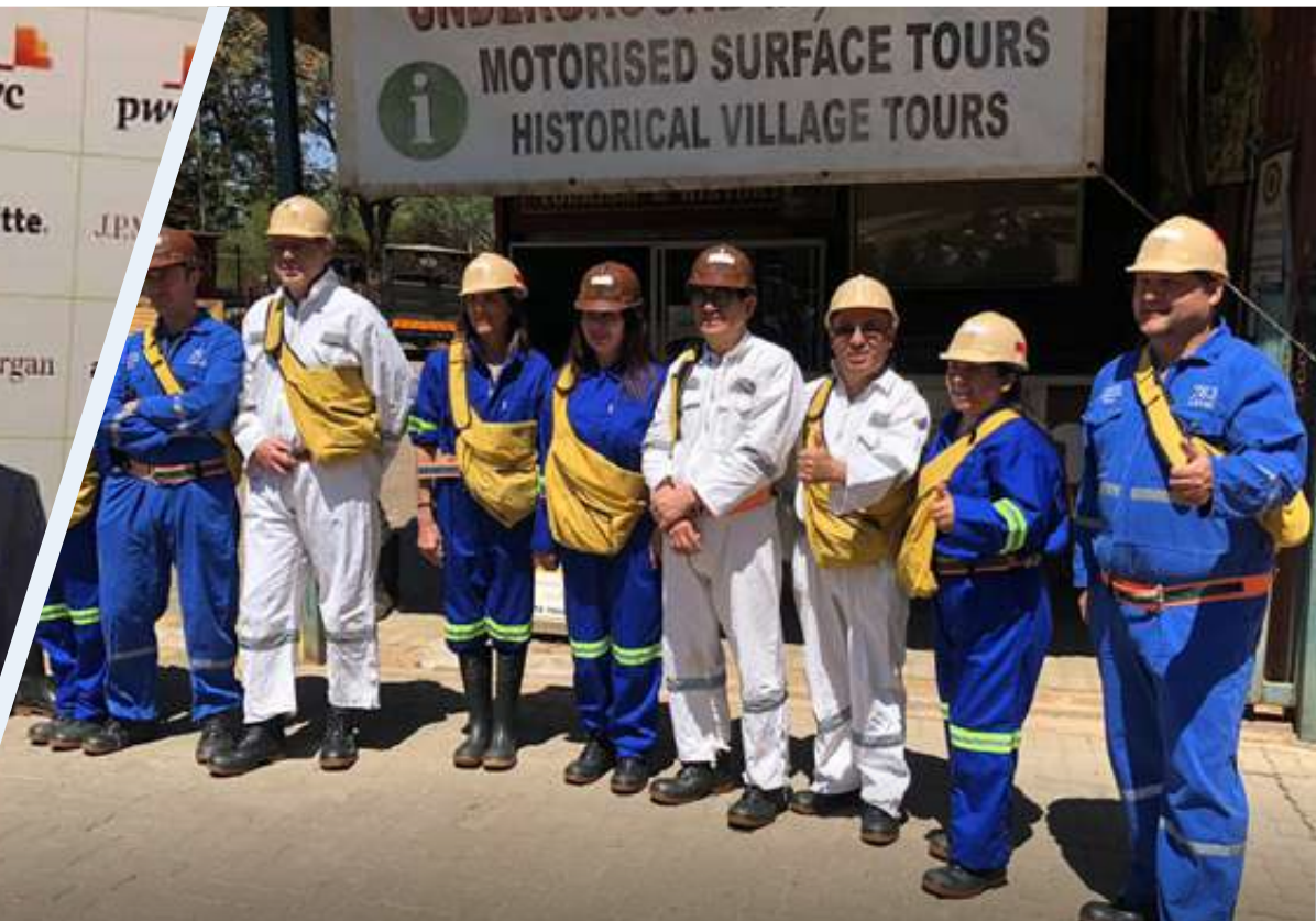
VISITA TÉCNICA A MINA

Gracias a las gestiones de CAMIPER Escuela de Altos Estudios, estuvo presente en este importante evento la única representación peruana, la cual fue reconocida por las grandes personalidades de la industria, como el ministro de Recursos Minerales y Energía de Sudáfrica, Gwede Mantashe.