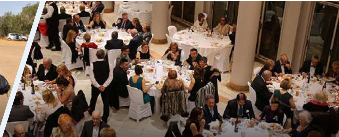
CENA DE GALA