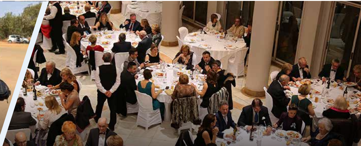
CENA DE GALA