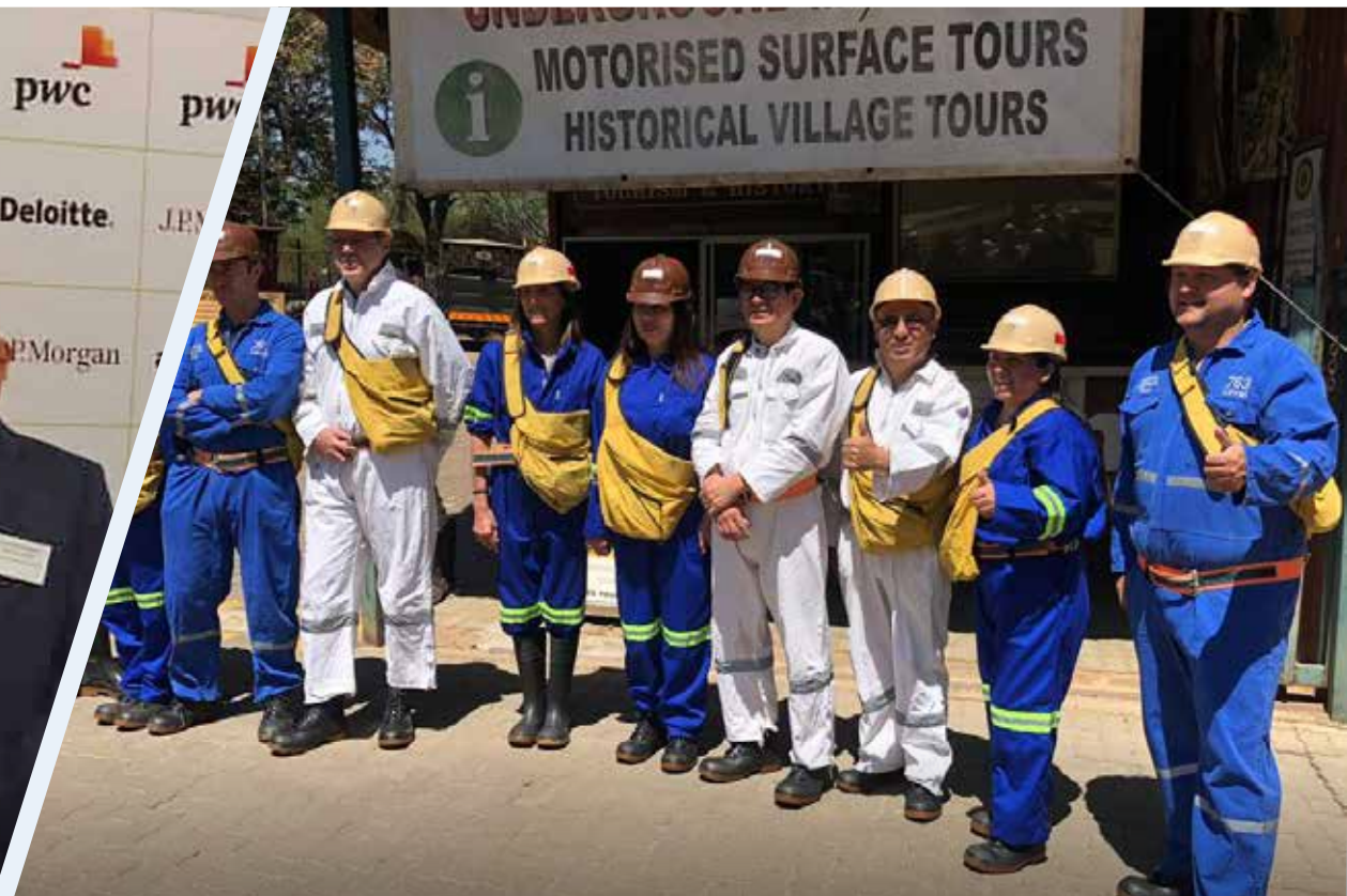
VISITA TÉCNICA A MINA

Gracias a las gestiones de la Cámara Minera del Perú, estuvo presente en este importante evento la única representación peruana, la cual fue reconocida por las grandes personalidades de la industria, como el ministro de Recursos Minerales y Energía de Sudáfrica, Gwede Mantashe.