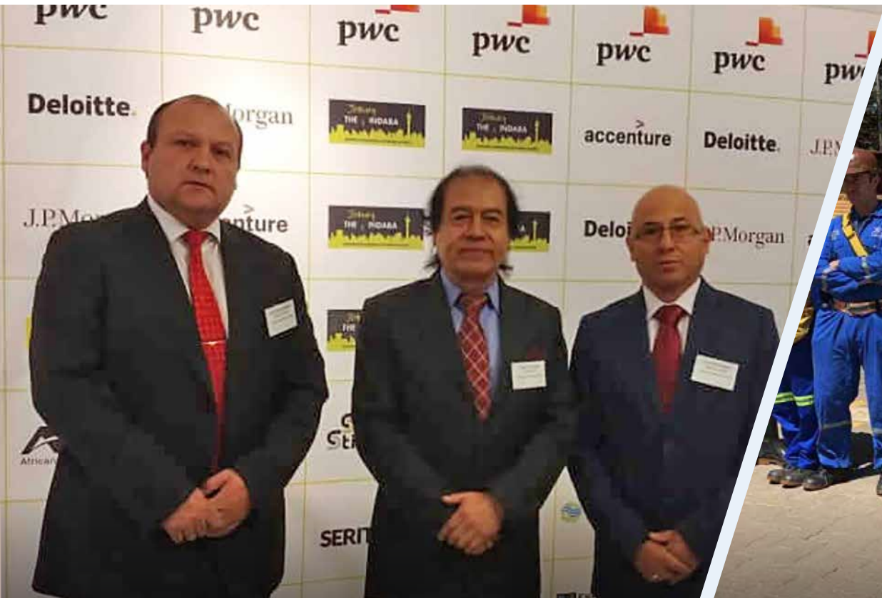
ASISTENCIA A CONGRESO MUNDIAL THE JOBURG INDABA: OCTUBRE 2019