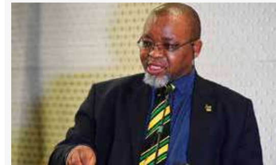
MBA GWEDE MANTASHE. Ministro de Recursos Minerales y Energía de Sudáfrica

La oportunidad generada en Sudáfrica fortalece las relaciones bilaterales con Chile. Ha sido una experiencia de primer nivel, en donde CAMIPER me acompañó día a día. Recomendable.